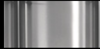
C Polished Chrome