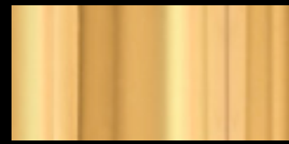
K Polished Gold

эта синусоидальная и динамичная композиция из стеклянных пластин отлично подходит для больших площадей, и придает особый оттенок жилым интерьерам.